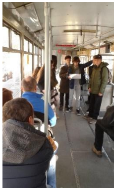
Čítanie v električke

Pevne verím, že toto podujatie prehĺbilo u detí vzťah ku knihám a k samotnému čítaniu, že sa cítili v prostredí školskej knižnice dobre a že si naplno uvedomovali poslanstvo, ktoré sme chceli týmto podujatím priniesť a budú ho niesť ďalej celým svojím životom.