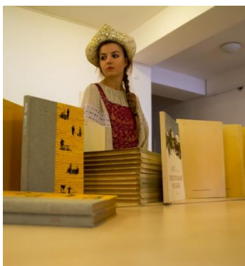
Dni ruskej kultúry

Naša škola vo veľkej miere podporuje vlastnú tvorbu žiakov a zapájame sa do súťaže Jazykový kvet . Žiaci tvoria vlastnú poéziu a prózu a nacvičujú divadelné predstavenia v cudzích jazykoch, ktoré prezentujú nielen na súťaži, ale aj pred žiakmi, pred rodičmi i učiteľmi.