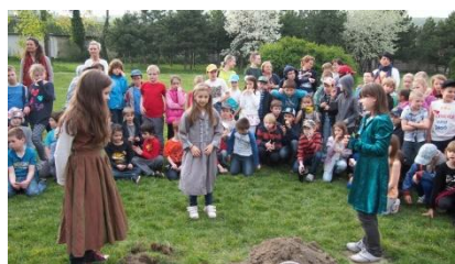
Sadíme Strom poznania

Pre mladších žiakov na prvom stupni pripravujeme každý rok podujatie Noc s Andersenom , na ktorom deti čítajú, riešia rôzne úlohy, prezentujú divadielka a každoročnou tradíciou je zasadenie mladého stromčeka, ktorý nazývame Strom poznania . Triedy majú počas roka rozdelené služby a o vysadené stromčeky sa starajú.