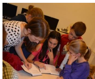
Pracujeme v skupinách