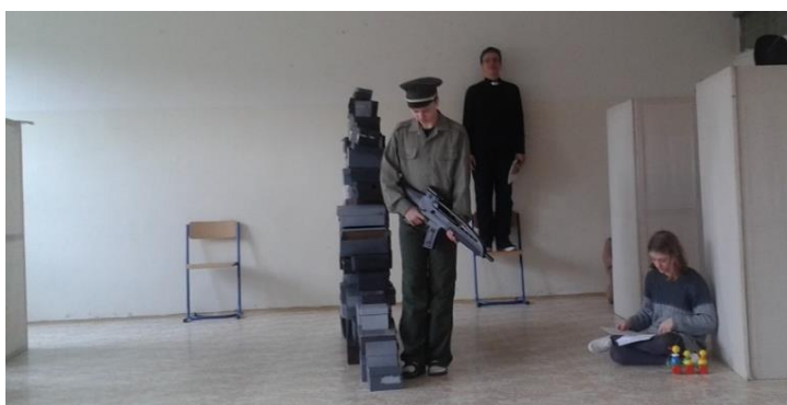
Predstavenie v nemeckom jazyku o Berlínskom múre