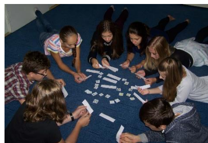
Riešenie problémovej úlohy

Aby bolo učenie efektívne, nestačí teda len čítať, počúvať a vidieť, ale aktívne sa zapájať, byť súčasťou procesu, prispieť vlastnou činnosťou. Vhodnou formou výučby je projektové vyučovanie, pri ktorom môžu žiaci pracovať individuálne, v dvojiciach či v skupinách. Po vypracovaní projektu nasleduje prezentácia a diskusia. Na našej škole realizujeme i dlhodobé projekty, na ktorých žiaci pracujú počas celého školského roka. Podľa veku ich rozdeľujeme na ročníkové práce, projektové práce a stredoškolskú odbornú činnosť. Tieto projekty sa zameriavajú vo väčšej miere na procedurálne poznatky než na faktické. Najdôležitejšiu časť projektu tvorí vlastný prínos – niečo, čo žiak sám vymyslí, zhotoví, navrhne (príklady z literárnych prác: vlastná kniha, komixový časopis, videodokument, informačný bulletin a pod.). Najväčší prínos tejto činnosti je príprava na budúce písanie podobných prác (napr. na vysokých školách) a tiež rozvíjanie prezentačných zručností žiakov.