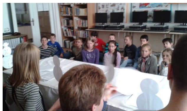
Dramatizované čítanie mladším žiakom