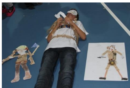
Takto si predstavujeme Jánošíka

Pre žiakov najobľúbenejšie podujatie, ktoré v škole organizujeme už mnoho rokov, je Noc s poviedkou . Toto podujatie pripravujeme pravidelne každý rok ako uvítanie žiakov ročníka práma na gymnáziu a pre veľký úspech i pre žiakov ročníka tercia. Napriek názvu Noc s poviedkou sme toto podujatie rozšírili aj o iné literárne žánre alebo žánrové varianty, a tak sme uskutočnili napr. Noc s detektívkou, Noc s rozprávkou, Divadelnú noc, Fantasy noc a iné. Hlavnú časť tohto podujatia predstavujú stanovišťa, ktorými musia žiaci v tímoch prejsť. Na stanovištiach ich čakajú rôzne úlohy literárneho, ale i hudobného a výtvarného zamerania. Okrem napínavého programu sa žiaci, samozrejme, tešia na nocovanie v škole.