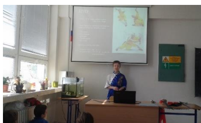
Prezentácia ročníkových prác

Aby bolo učenie efektívne, nestačí teda len čítať, počúvať a vidieť, ale aktívne sa zapájať, byť súčasťou procesu, prispieť vlastnou činnosťou. Vhodnou formou výučby je projektové vyučovanie, pri ktorom môžu žiaci pracovať individuálne, v dvojiciach či v skupinách. Po vypracovaní projektu nasleduje prezentácia a diskusia. Na našej škole realizujeme i dlhodobé projekty, na ktorých žiaci pracujú počas celého školského roka. Podľa veku ich rozdeľujeme na ročníkové práce, projektové práce a stredoškolskú odbornú činnosť. Tieto projekty sa zameriavajú vo väčšej miere na procedurálne poznatky než na faktické. Najdôležitejšiu časť projektu tvorí vlastný prínos – niečo, čo žiak sám vymyslí, zhotoví, navrhne (príklady z literárnych prác: vlastná kniha, komixový časopis, videodokument, informačný bulletin a pod.). Najväčší prínos tejto činnosti je príprava na budúce písanie podobných prác (napr. na vysokých školách) a tiež rozvíjanie prezentačných zručností žiakov.