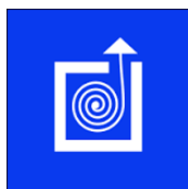
Logo Školy pre mimoriadne nadané deti a Gymnázia v Bratislave