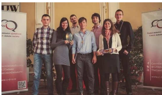
Každoročná účasť na debatnej súťaži v Prostějove v ČR

Na rozvoj čitateľskej gramotnosti v cudzích jazykoch pripravujeme Kultúrne dni , počas ktorých sa venujeme umeniu, zvykom, tradíciám, kultúre krajín, ktorých jazyky sa v škole učíme. Počas programu uskutočňujeme vedomostné kvízy, súťaže, ochutnávku tradičných jedál, žiaci pripravujú powerpointové prezentácie, recitujú známe diela, hrajú na hudobných nástrojoch a spievajú, prezentujú divadelné predstavenia.