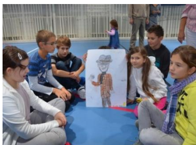
Takto vyzerá detektív