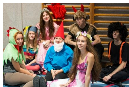
Pomáhajú starší žiaci

Pre mladších žiakov na prvom stupni pripravujeme každý rok podujatie Noc s Andersenom , na ktorom deti čítajú, riešia rôzne úlohy, prezentujú divadielka a každoročnou tradíciou je zasadenie mladého stromčeka, ktorý nazývame Strom poznania . Triedy majú počas roka rozdelené služby a o vysadené stromčeky sa starajú.