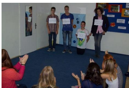
Žiaci pri dramatizácii hry Čakanie na Godota